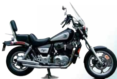
VT 1100 Shadow, 79 hk V-Twin 1985