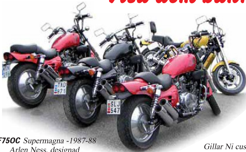
VF750C Supermagna -1987-88 Arlen Ness, designad samlarcustom med PULVER!

Gillar Ni custom hojar ? Men saknar motorstyrkan, jag har de rätta modellerna. Hondas USA tillverkade fulleffekt custom.