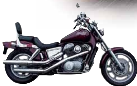
VT 1100 Shadow 1987-1996