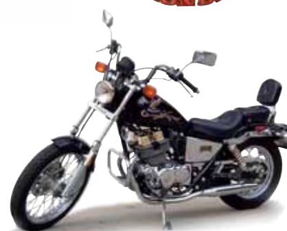
1986 CMX 250 Rebel Limited Edition (24 K guld)

Egen import av Hondas USA modeller, tar även hem USA bilar mm på beställning