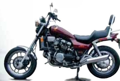
V 65 Magna (1100 cc) (V4) 116 hk

Bilden i mitten är tagen vid Gleasons rekordkörning i Kalifornien med en standard V65 magna. Kvartsmilen kördes på under 11 sekunder vilket gjorde att den hamnade i Guinness rekordbok som världens snabbaste standardmotorcykel under 80-talet.